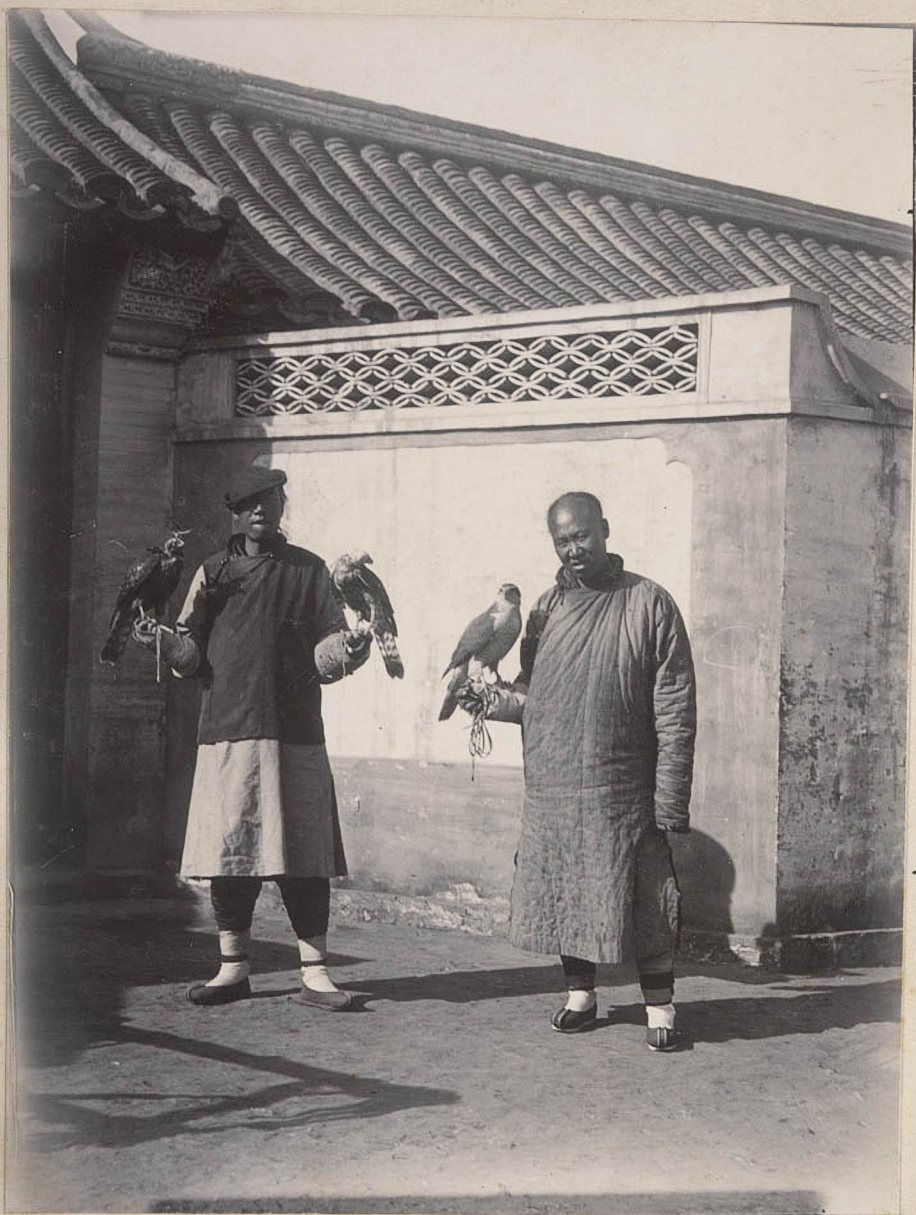
Two Falconers at my Home Gate