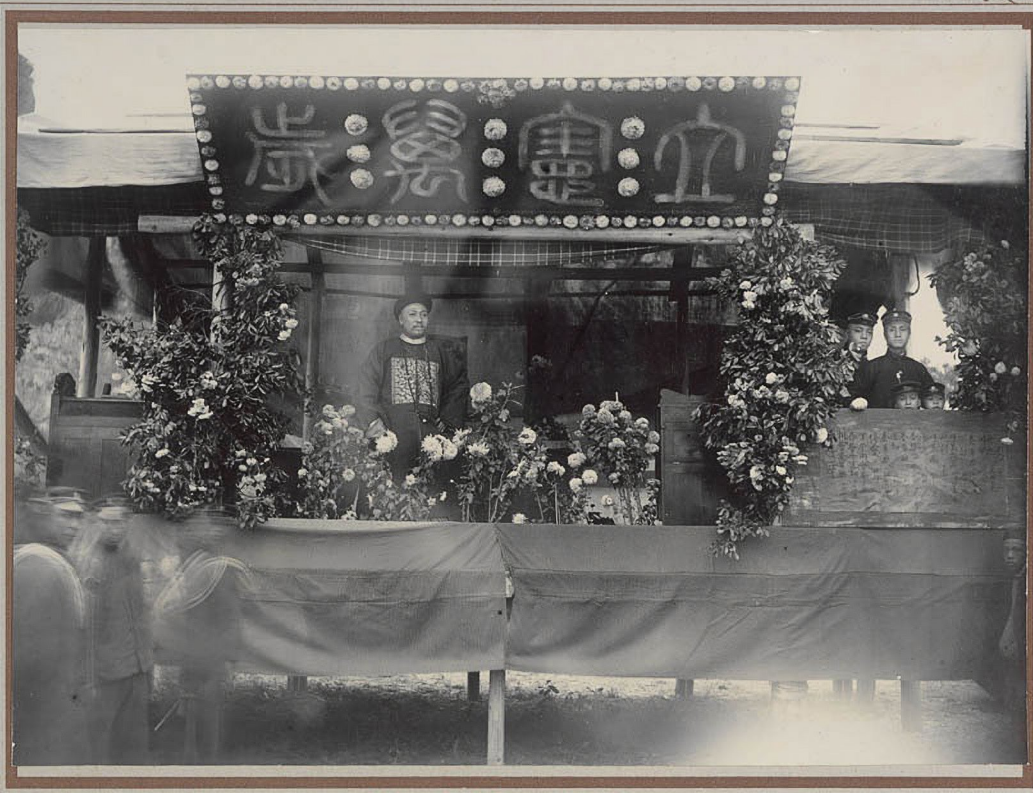
桂林學院街容芳齋照相館